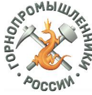
俄罗斯采矿业专家非赢利性机构