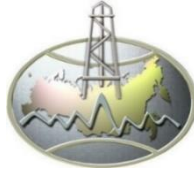
俄罗斯自然资源与生态部