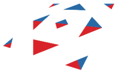
俄罗斯出口中心股份公司